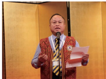
マレーシア 南クチン市 市長 ダトー・ジェイムス・チャン・カイ・シン 氏