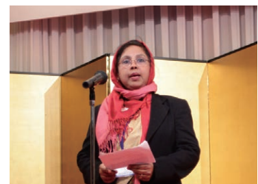
バングラデシュ 女性児童大臣 メハー・アフロゼ 氏